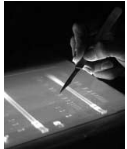
Forscher bei der Auswertung von genetischen Sequenzen

(B) All that which only life itself, not to speak of conscious life yet, can cause, needs another explanation. Life and especially conscious life, possesses a nature irreducible to the genetic code which, on the contrary, presupposes life to become effective. Moreover, each human being possesses a unique and unrepeatable identity which can in no way be explained through a genetic code that remains in principle repeatable – in twins or, by a tiny chance of repetition, even outside identical twins – and its effects. No intentional act of taking cognizance of something, of knowing that such and such an event took place, no act of understanding an evident truth can ever be