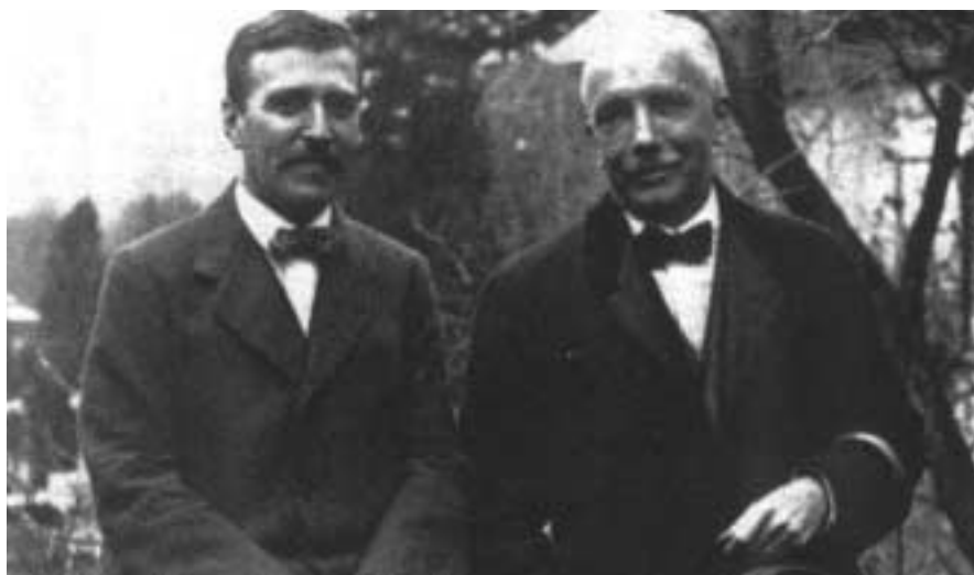
Hugo von Hofmannsthal (links) mit Johann Strauss (rechts)

Seien es nun menschliches Weinen und Elend, der Schrei der Flöte oder Blüten und Fluren – menschliche und natürliche Sphäre eng verklammert und parallelisiert, in der fünften Strophe beispielsweise durch die gleichförmigen Präsenzpartizipien – nichts wird ausgeführt, kein Einzelnes wird hervorgehoben oder auch nur deutlich, alles hat den gleichen Stellenwert, es findet sich zusammen, um ein heimliches Leben von träumender Bewegung und flüchtigem Wesen, von Schönheit und Schatten zu beschwören. Nicht das Tun und