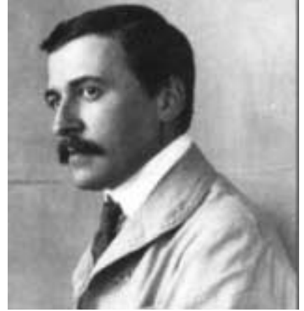
Hugo von Hofmannsthal

Immer wieder wird Lyrik angeboten – seien es nun die verträumten, naturverliebten Gedichte der Romantik, etwa von Brentano und Eichendorff, oder die der großen Dichter in der ersten Hälfte des 20. Jahrhunderts – Hofmannsthal, George, Trakl, Rilke und Benn. Lyrisches Sprechen ist das genaueste, gleichzeitig zeichnet es sich aus durch die kühnste Verwendung von Sprache, die Wörter erscheinen in ihrer Vielschichtigkeit, mit ihren verschiedenen changierenden Bedeutungsebenen. Es geht gerade nicht um eindeutiges Sprechen wie in der Philosophie, im Gegenteil, ein Gedicht appelliert an die Freiheit jedes