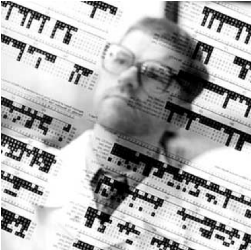
Der Mensch als Kartographie?