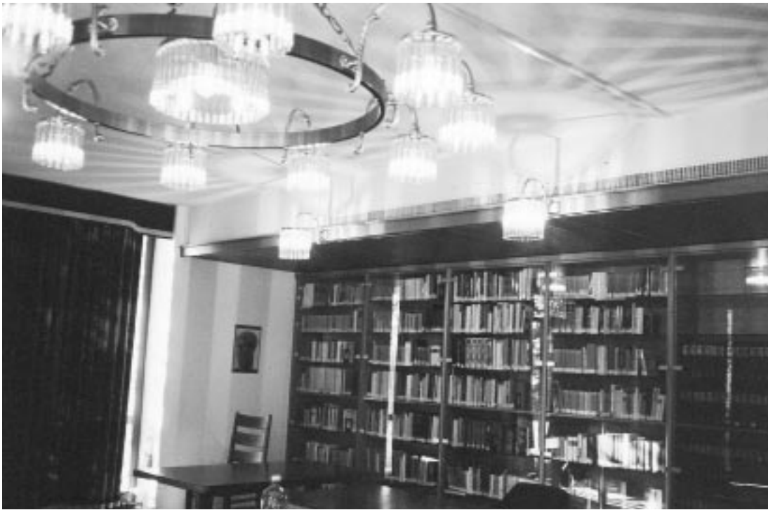
Der Platonsaal der Bibliothek

Unsere ca. 11'000 Bände umfassende Bibliothek besteht zum grössten Teil aus philosophischer Fachliteratur (hauptsächlich deutsch und englisch, aber auch italienisch, französisch, spanisch, lateinisch, altgriechisch und polnisch) mit den folgenden Schwerpunkten: